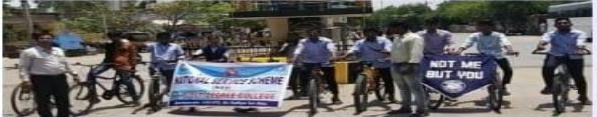
విద్యార్థులు అవగాహనకల్పించారు, విద్యార్థులు, యువకులు, అధిక సంఖ్యలో పాల్గొన్నారు.